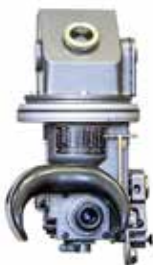
TPN-1-49-23 /M celownik noktowizyjny