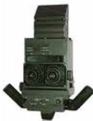
POD-72 *) przyrząd obserwacyjny d-cy czołgu