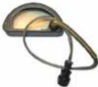
SE-2P.000 / M