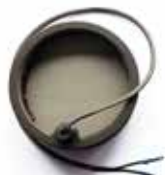
Szkło celownika peryskopowego