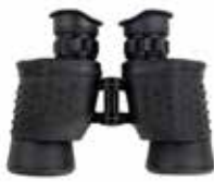
Lornetka pryzmatyczna 7x45 (z)