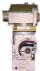
PCN-A *) pasywny celownik noktowizyjny