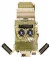
TKN-3 /M przyrząd obserwacyjny d-cy czołgu