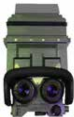
PNK-72 *) noktowizor kierowcy