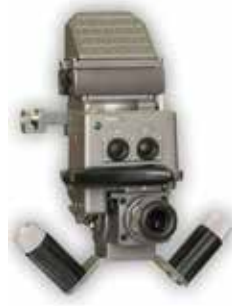
TKN-1S/M noktowizor dowódcy