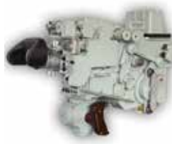
Celownik TPD-K1/M *)