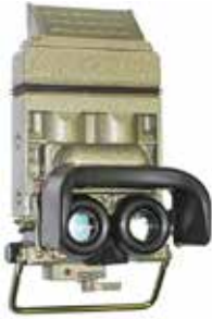
TWNO-2 / M noktowizor kierowcy