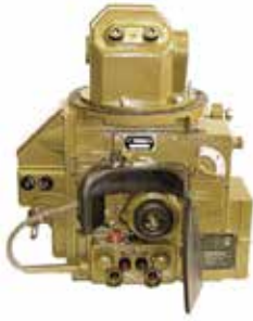
1PN-22-M1(2) / M celownik peryskopowy