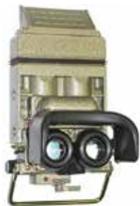
TWNO-2 noktowizor kierowcy