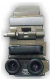
TPKU-2B dzienne urz. obserw. d-cy