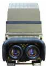
TWNE-4PAM.4 B/M noktowizor kierowcy