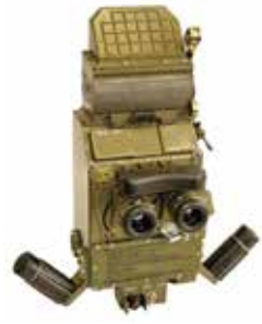
TKN-3 B/M noktowizor dowódcy