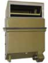
Peryskop obserwacyjny TNPO-170A