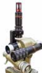
Kątomierz busola PAB-2 (A)