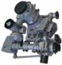
Celownik mechaniczny, Celownik na wprost OP5-37