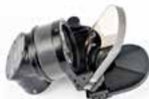
Celownik kolimatorowy 12,7 mm wkm DSzK