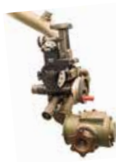
Celownik mechaniczny WR-40