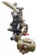
Celownik mechaniczny RM-70